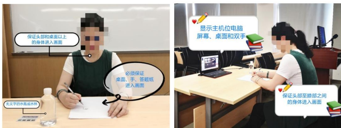
机位屏幕显示效果图